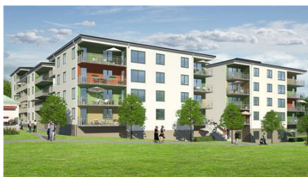
Brf, Pyramidalmen, Älvsjö

Juni: Vi har börjat med invändiga arbeten.