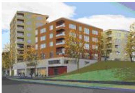
Björkbacken, besiktigade restaurangen i gula höga huset

Nytt oktober: Första besiktningen har just varit, huvuddel 2, restaurang och storkök. Gott resultat för vår del.