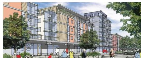
Arkitektvision över Enebybergs Torg

Nytt oktober: Projektet rullar på. Vi har haft besiktning av de tre sista trapphusen i etapp 2.