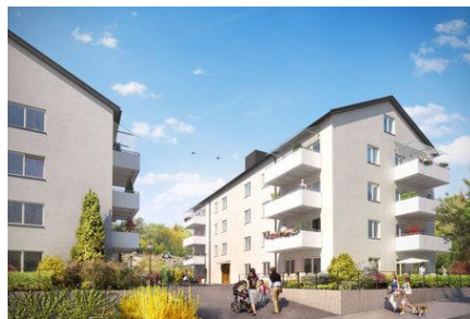
Ängby Park, Blackeberg

Nytt oktober: Här går det enligt plan, nu öppnar vi område 2.