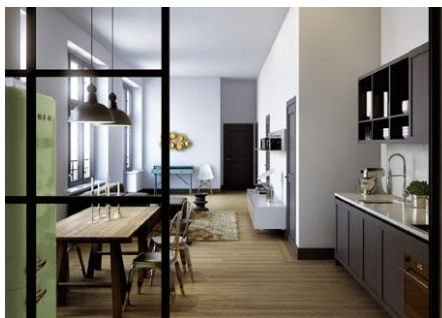
Från visningslägenheten, Kv. Pagen