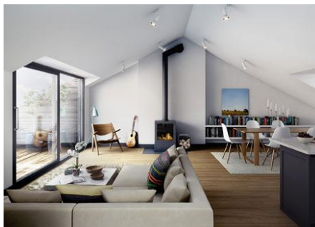
Vindsvåning, Kv. Pagen