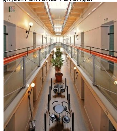
Idag är cellerna ombyggda till vandrarhem

Under fängelsetiden hann man både med att döma Sveriges sista häxa 1756 såväl som det sista dödstraffet 1910. Enda gången giljotin använts i Sverige.